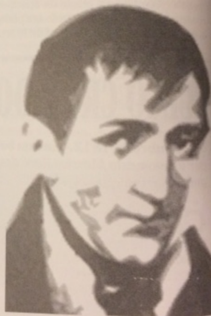
El periodista rebelde José Joaquín Fernández de Lizardi nació en 1776.

Fue así que Venegas ordenó la suspensión de estas publicaciones y dictó la prisión para los dos periodistas, pero sólo pudo hacer encarcelar a Lizardi. Bustamante, alerta a tiempo, se ocultó y nadie conoce su paradero.